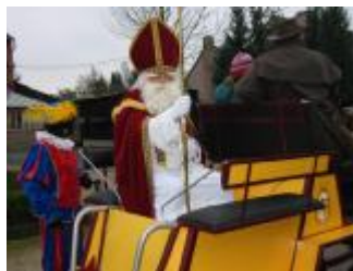
De Sint en zijn Pieten op ronde in d'Hellicht

schenk uit de handen van de Sint, maar anders dan vroeger willen we dit jaar de Heilige Man zelf verrassen door hem vanuit onze buurt speelgoed aan te