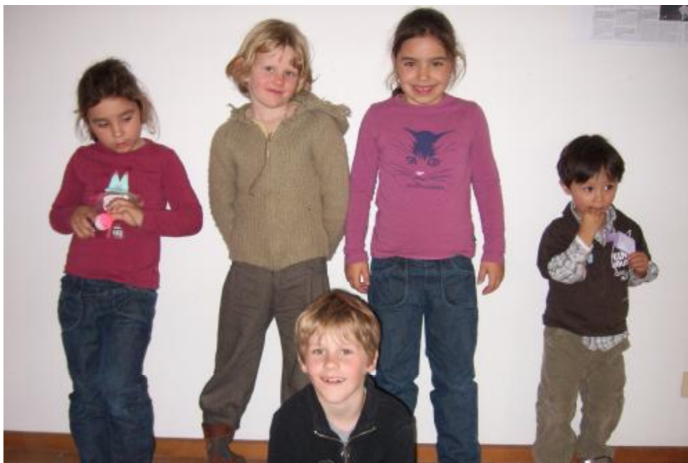
Drie van de vier winnaars van de ballonwedstrijd tijdens de prijsuitreiking op 11 november. Ze poseren alsof ze nooit iets anders gedaan hebben..!